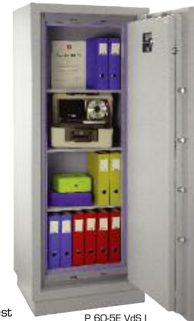
P 60-5E VdS I