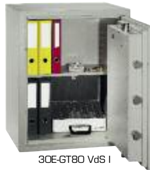
30E-GT80 VdS I