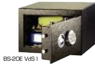
BS-20E VdS I