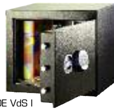
BS-30E VdS I