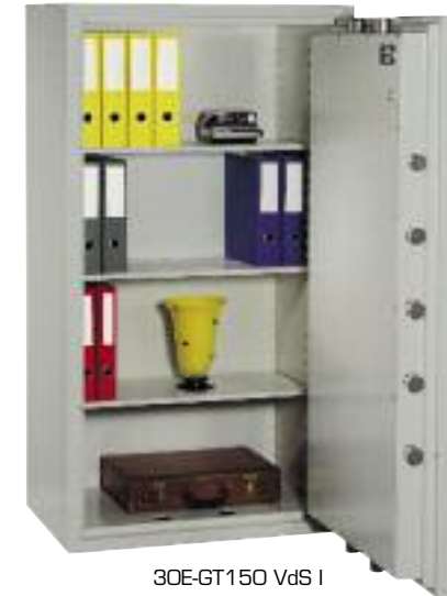
30E-GT150 VdS I

Qualität und Sicherheit steht an erster Stelle: Die professionelle, starke Alternative für Fr. 50'000.- Versicherungs-Summe.