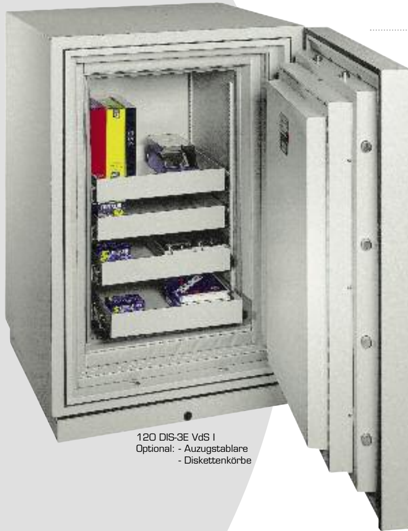
120 DIS-3E VdS I Optional: - Auzugstablare - Diskettenkörbe