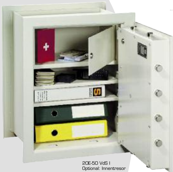
20E-50 VdS I Optional: Innentresor