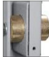
Doppelte Riegelbolzenführung mit 40 mm Bolzen