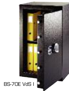
BS-70E VdS I