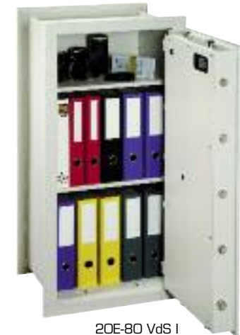
20E-80 VdS I

Der optimale Tresor für Privatkunden mit hohen Sicherheitsansprüchen, speziell wenn emotionelle Werte wie Schmuck, Uhren, Münzen- und Briefmarkensammlungen und andere unersetzbare Gegenstände gesichert werden müssen.