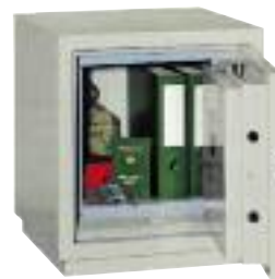
P 60-2E VdS I