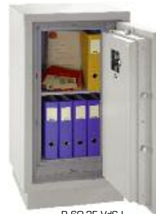
P 60-3E VdS I