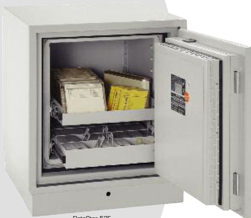
DataStar 53E Optional: - Diskettenkorb - Auszugsschublade