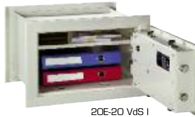
20E-20 VdS I