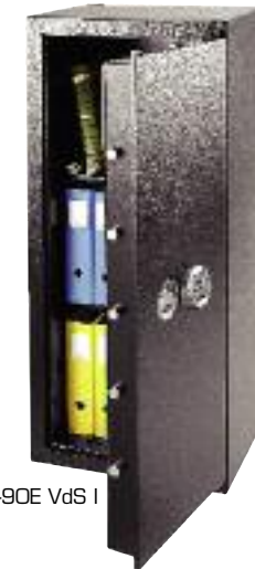
BS-90E VdS I

Der optimale Tresor für Privat- und Geschäftskunden mit hohen Sicherheitsansprüchen, speziell wenn emotionelle Werte wie Schmuck, Uhren, Münzen- und Briefmarkensammlungen sowie andere unersetzbare Gegenstände gesichert werden sollen.