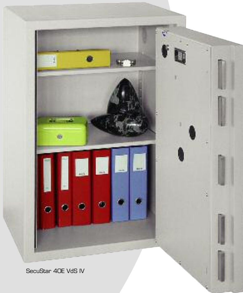
SecuStar 40E VdS IV