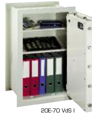
20E-70 VdS I