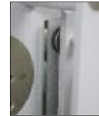
Notverriegelung mit Glasplatte gesichert