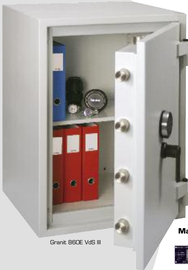
Granit 860E VdS III