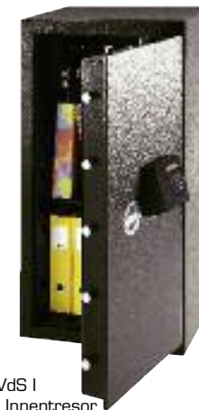
BS-80E VdS I Optional: Innentresor + Paxos Set 1