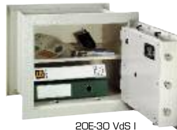
20E-30 VdS I