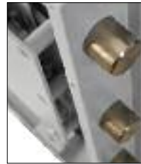
Massiver Gehäuse- und Tür Aufbau mit High-Tech-Füllmaterial