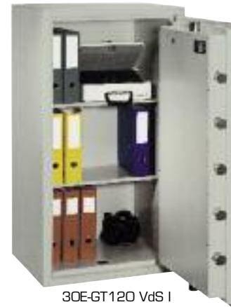
30E-GT120 VdS I