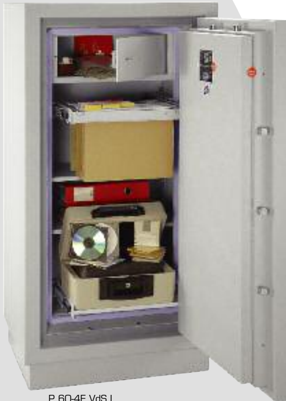
P 60-4E VdS I Optional: - Innentresor - Hängeregistraturauszug - Auszugstablar