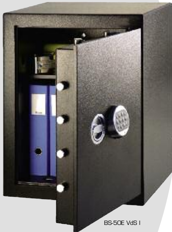
BS-50E VdS I

Kassenschränke schwere Bauart VdS-Klasse I 10 Jahre Garantie gegen Aufbruch