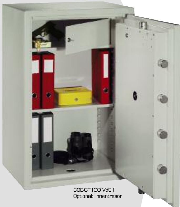
30E-GT100 VdS I Optional: Innentresor